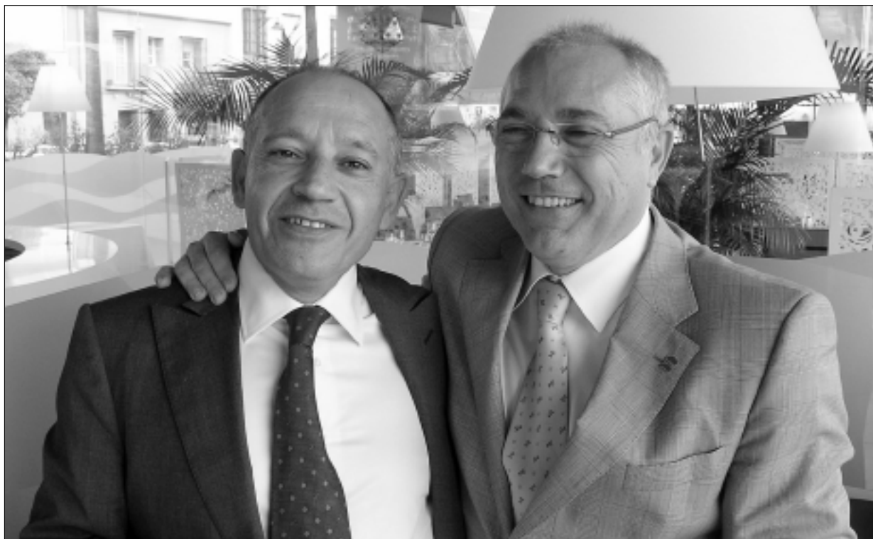
Imagen que resume el entorno y el ambiente del foro CIRIEC

Leopoldo Pons Albentosa Tesorero de CIRIEC-España