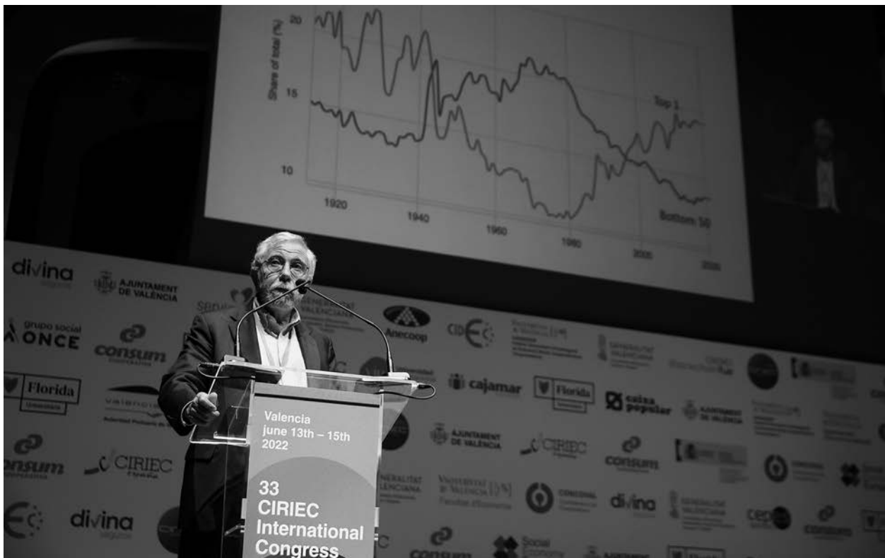
33 CONGRESO INTERNACIONAL DEL CIRIEC, VALENCIA 2022 · CONFERENCIA INAUGURAL