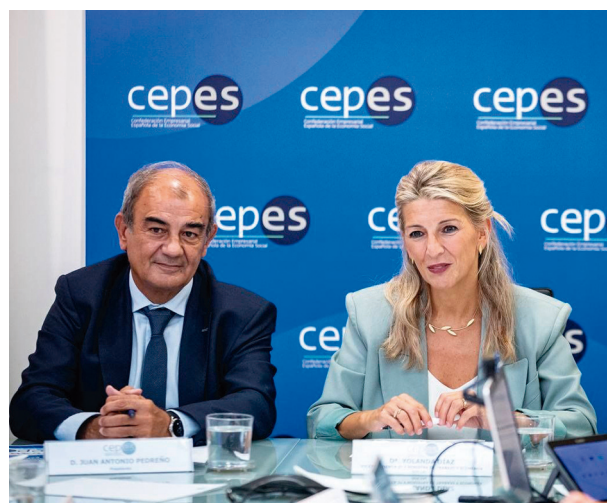
El presidente de CEPES, Juan Antonio Pedreño, y la ministra Yolanda Díaz.

También se proponen enmiendas para asegurar un desarrollo reglamentario adecuado, como el de la acreditación de empresas de economía social y la creación de un catálogo de entidades de economía social, pendiente desde hace más de una década. Estas modificaciones, según CEPES, “son cruciales para garantizar la viabilidad y el desarrollo de las empresas de inserción y cooperativas, al tiempo que promueven la igualdad de oportunidades en su funcionamiento interno”.