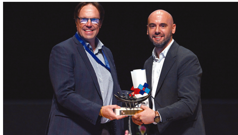
Primer premio en la Categoría de Integración Sociolaboral para Taller Àuria.

Crea colecciones de perfumería, desde la elaboración de la fragancia hasta el diseño, es decir, se ocupa de la producción integral del producto para cadenas de retail y marcas líderes. Dispone de una planta industrial de 10.500 m 2 en Igualada, en el corazón del clúster del sector de la cosmética, con una cifra de negocio al umbral de los 20 millones de euros y una ocupación de 450 personas.