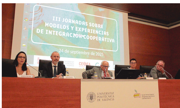
Mesa debate “Retos de futuro de las cooperativas en los sectores hortofrutícola, vitivinícola y aceite: la importancia de la dimensión”.

euros en el ejercicio 23-24, y un volumen comercializado de 460 millones de kg de frutas, consolidándose como la tercera cooperativa española por volumen de exportación.