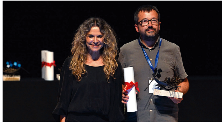
Primer premio en la Categoría de Vivienda a la cooperativa Sostre Cívic

Esta cooperativa es fabricante de perfumes, cosmética y ambientación de hogar con un destacado enfoque social. Es, por ejemplo, el proveedor de perfumes de la marca Stradivarius (Inditex).