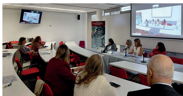
Paneles de expertos del 2º Congreso Jurídico de CIRIEC-España.

Asociativa (EBAs), figura singular de la economía social catalana. Las EBA nacieron en Cataluña en 1996 con el objetivo de que equipos de médicos y enfermeras, con amplia experiencia, proporcionaran servicios de Atención Primaria autogestionada a un determinado número de habitantes del territorio. Estas sociedades se crearon mediante un contrato con el CatSalut y actúan bajo su supervisión.