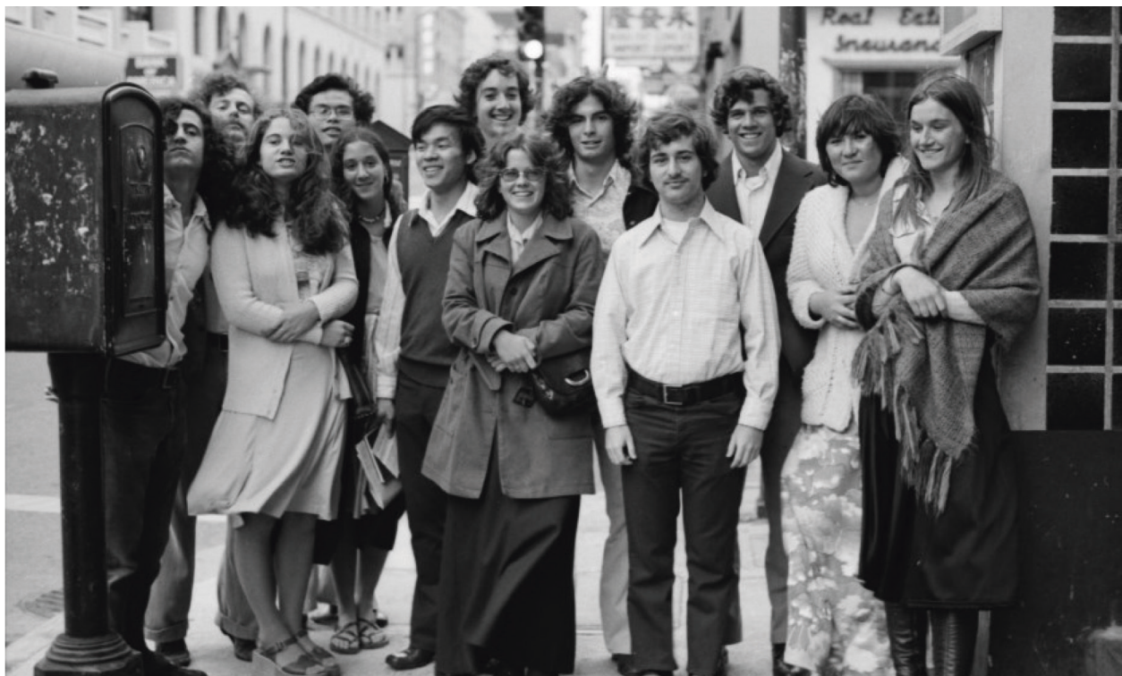
Estudiantes residentes de 1975 del Stebbins Hall en un viaje al Chinatown de San Francisco. https://ataridogdaze.com/time-machine/stebbins1975/index.shtml

A pesar de los programas de ayuda federal en los Estados Unidos como la Pell Grant, que ha perdido su poder de cobertura a lo largo de las décadas, la BSC ha logrado mantener una alternativa de vivienda y alimentación accesible para estudiantes de bajos ingresos en los Estados Unidos. Un informe de la BSC resalta que el costo de vivir en la cooperativa es menos de la mitad que en otras opciones de alojamiento, lo que la convierte en una herramienta crucial para la movilidad social y la inclusión de estudiantes de primera generación, minorías y migrantes indocumentados.