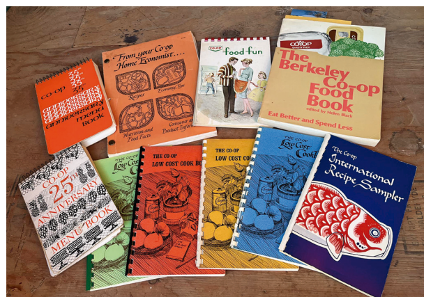
Una ventana al pasado: fragmentos de escritos históricos compartidos en "Stories from the Berkeley Coop", una página de Facebook dedicada a preservar la memoria de las cooperativas de Berkeley.

perativos, aplicados antes de la Declaración sobre la Identidad Cooperativa, influyeron en el consumo local y la educación de sus miembros sobre el impacto ecológico de las grandes corporaciones. La preservación de sus archivos en la Biblioteca Bancroft de la Universidad de California es vista como una oportunidad invaluable para futuras investigaciones.