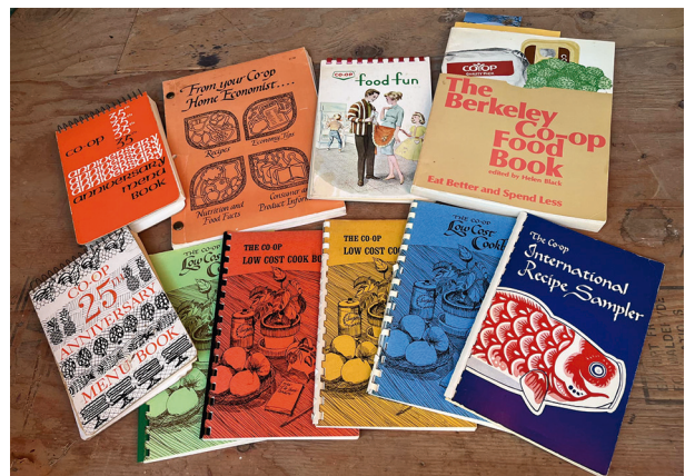
Una finestra al passat: fragments d'escrits històrics compartits en "Stories from the Berkeley Coop", una pàgina de Facebook dedicada a preservar la memòria de les cooperatives de Berkeley.