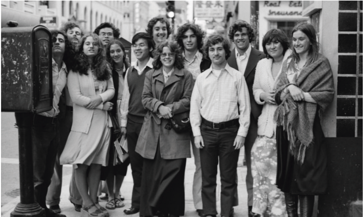
Estudiants residents de 1975 del Stebbins Hall en un viatge al Chinatown de San Francisco. https://ataridogdaze.com/time-machine/stebbins1975/index.shtml

A pesar dels programes d'ajuda federal als Estats Units com la Pell Grant, que ha perdut el seu poder de cobertura al llarg de les dècades, la BSC ha aconseguit mantindre una alternativa d'habitatge i alimentació accessible per a estudiants amb baixos ingressos als Estats Units. Un informe de la BSC ressalta que el cost de viure en la cooperativa és menys de la meitat que en altres opcions d'allotjament, la qual cosa la converteix en una eina crucial per a la mobilitat social i la inclusió d'estudiants de primera generació, minories i migrants indocumentats.