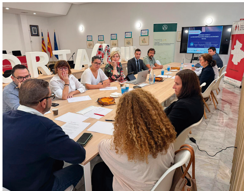
Presentación de la Guía el pasado mes de octubre en Torrent.

Entre las herramientas que se presentan, la Guía dedica un apartado importante a la colaboración público-privada (CPP) con la economía social. La CPP es hoy una herramienta imprescindible para ejecutar con